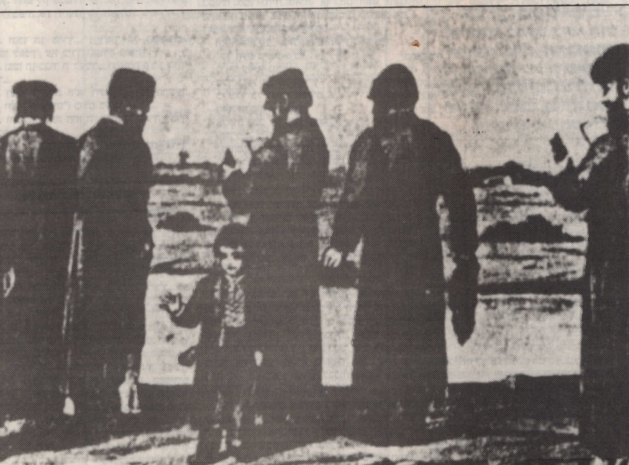
אשית המאה ה-20

ניגון נפסק ומרו התחי היא עומד רא שפר הוא מוסף להזכי הרא מאחר להרג חודש ובמיו חודש נו רב 96 עפ הע יו שנ מז 42 לב 55 וש חו עד ג