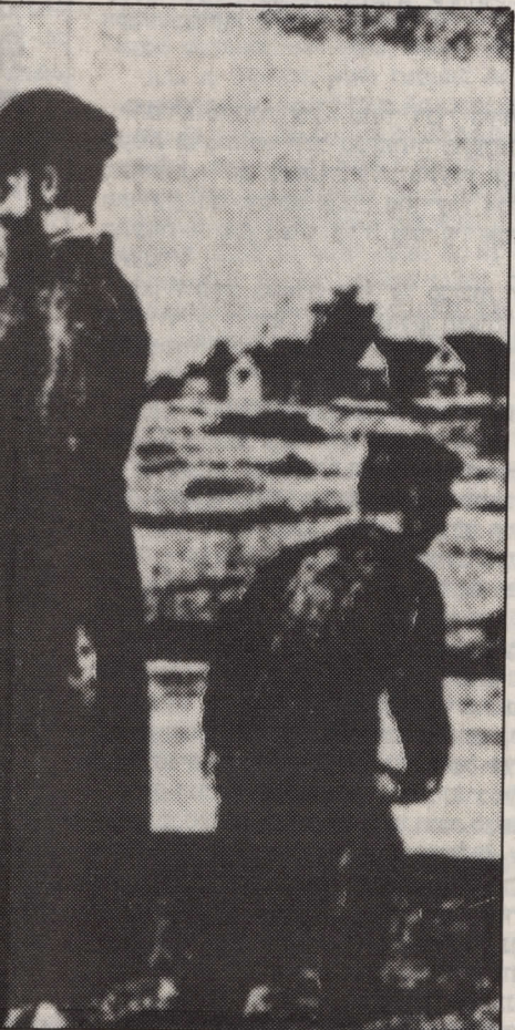
תשליך. ציור מאת ק. פלזנהארדט, ראש