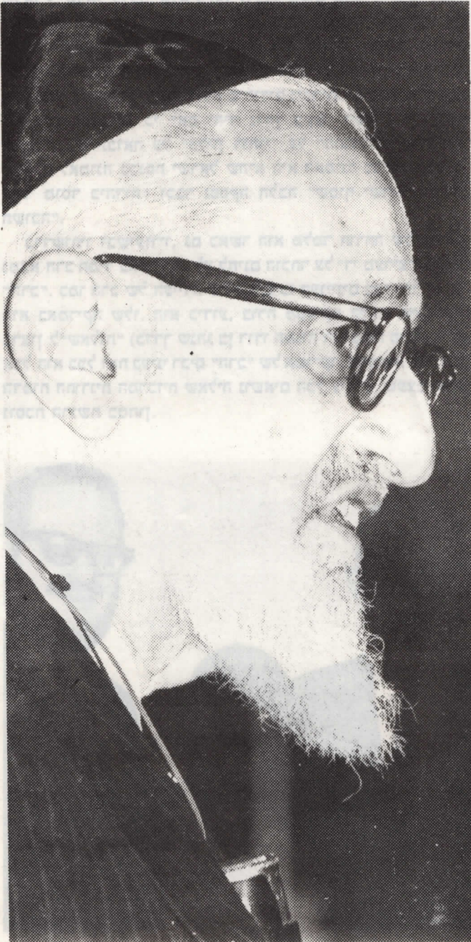
הרב יוסף דוב סלוביצי'יק

"שומרי שבת יש באמריקה — אבל אין בה יהודים של ערב שבת, ההולכים בכוונת הנשמה ובהמיית הלב לקראת שבת... יש לנו שומרי מצוות ביד, ברגל ובפה — אבל כמה מעטים הם היודעים עבודה שבלב מה היא?"